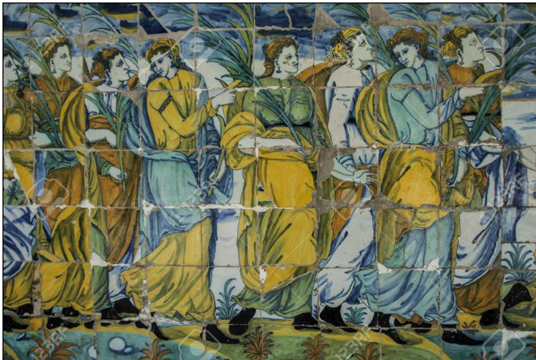
Azulejería del S. XVII. Basílica Ntra. Sra. Del Prado. Talavera de la Reina